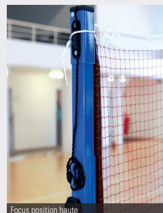
Focus position haute