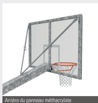
Arrière du panneau méthacrylate