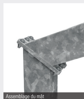
Assemblage du mât