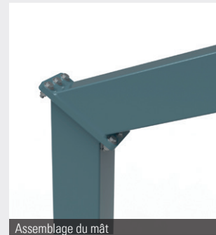
Assemblage du mât