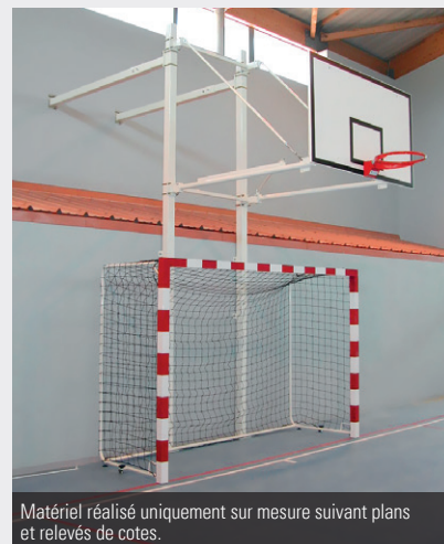
Matériel réalisé uniquement sur mesure suivant plans et relevés de cotes.