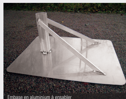
Embase en aluminium à ensabler