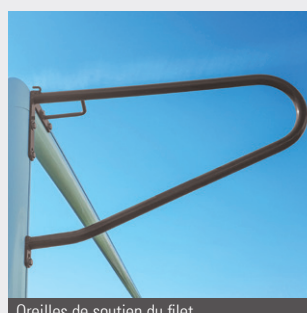
Oreilles de soutien du filet