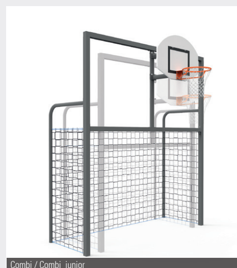
Combi / Combi junior