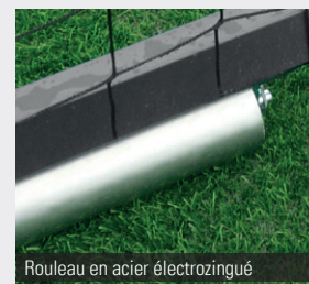
Rouleau en acier électrozingué