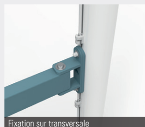
Fixation sur transversale