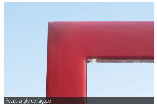
Focus angle de façade