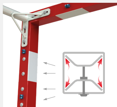
Focus fixation PostLock®, arceau et maillon de filet